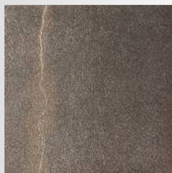
Nero by GM