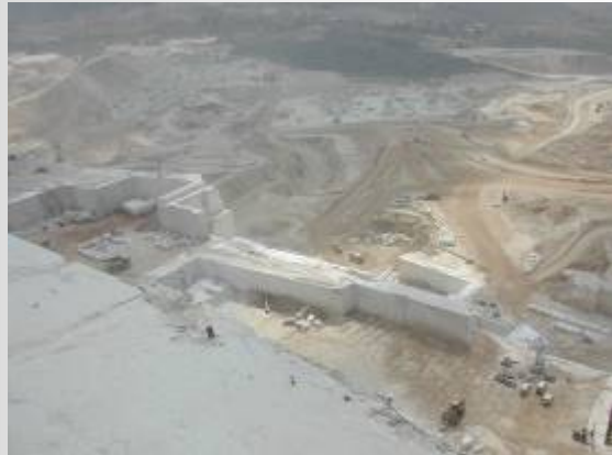
"TORTA " PREPARADA PARA SU DESPRENDIMIENTO EMPUJE CON CATERPILARS SOBRE "CAMA " PREPARADA