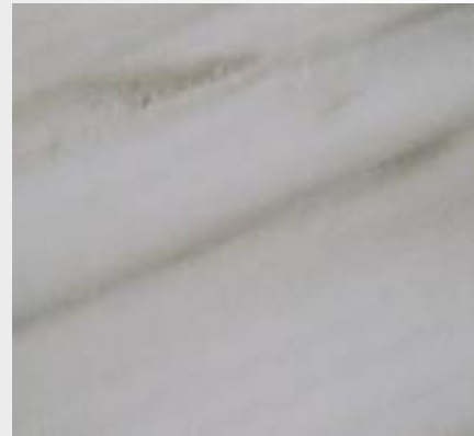
Blanco Río Veteado