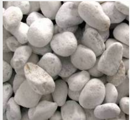
Triturado Blanco Macael