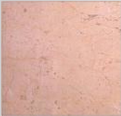
Crema Macael Ibérico