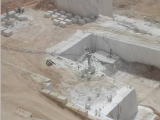
CORTE CON DIAMANTE DE LA "TORTA "